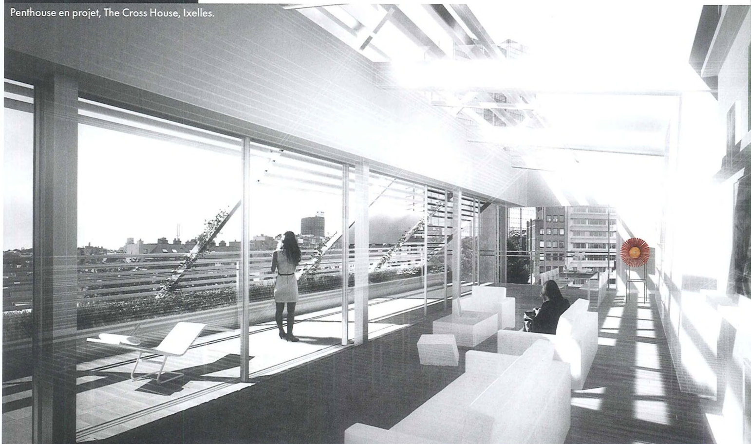
Penthouse en projet, The Cross House, Ixelles.