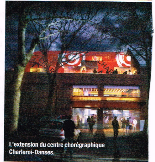
L'extension du centre chorégraphique Charleroi-Danses.