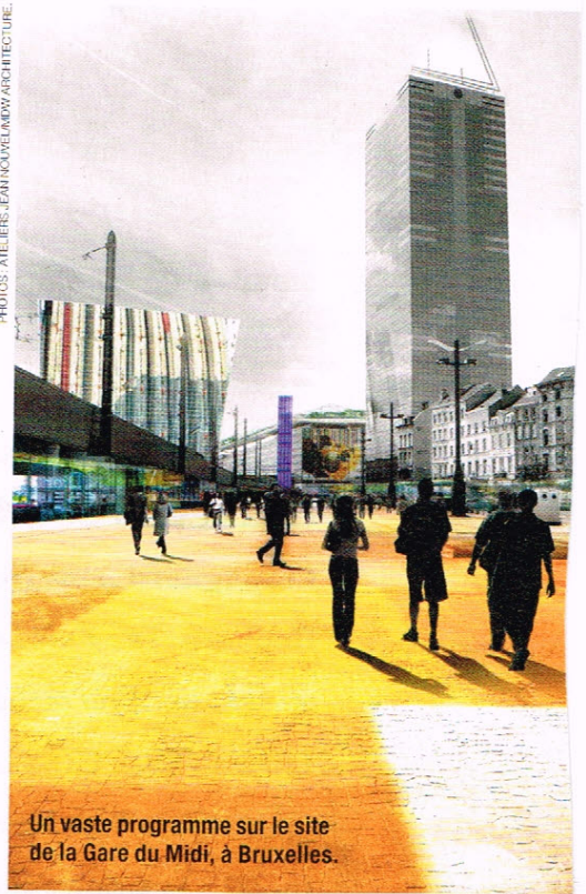
Un vaste programme sur le site de la Gare du Midi, à Bruxelles.

PHOTOS ATELIERS JEAN NOUVEL/MDW ARCHITECTURE.